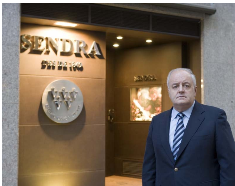
El propietari de Casa Sendra davant del "show room"

L'arribada de l'electricitat, el ferrocarril, i també el desenvolupament de la maquinària, procedent en alguns casos d'altres països europeus també amb una àmplia tradició en l'elaboració d'embotits, van ser detonadors perquè Sendra hagi continuat la seva expansió durant un segle i mig, mantenint sempre la qualitat de les primeres matèries, l'absència d'additius i els mateixos criteris artesanals d'elaboració, per la qual cosa el seu producte, en la nostra societat actual, podria ser considerat com a llonganissa de culte.